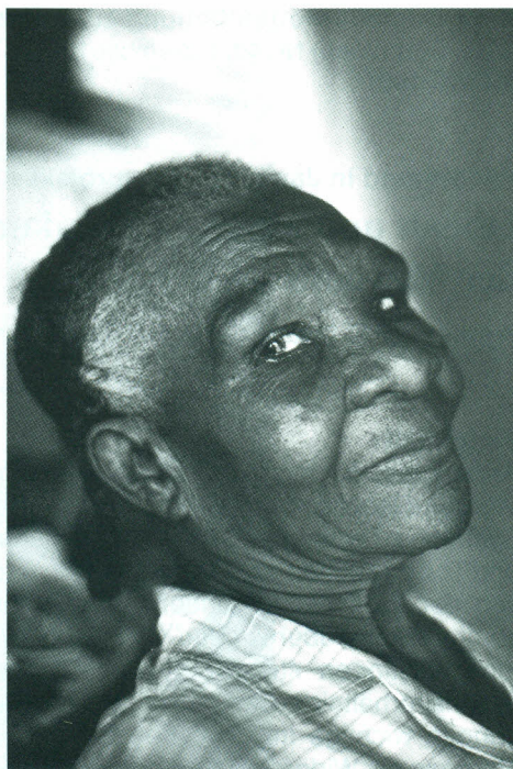
Abb. 4b. Myal Woman.